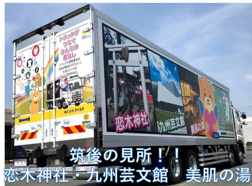
筑後の見所！！ 恋木神社・九州芸文館・美肌の湯