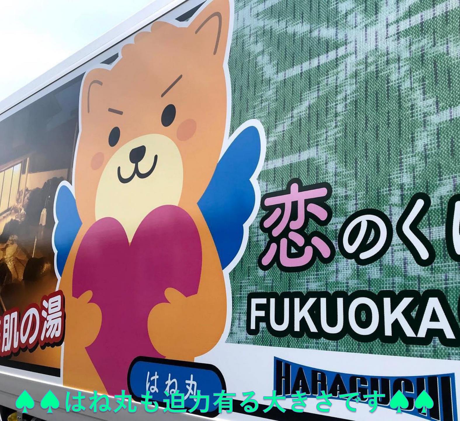
♠ ♠ はね丸も迫力有る大きさです ♠ ♠